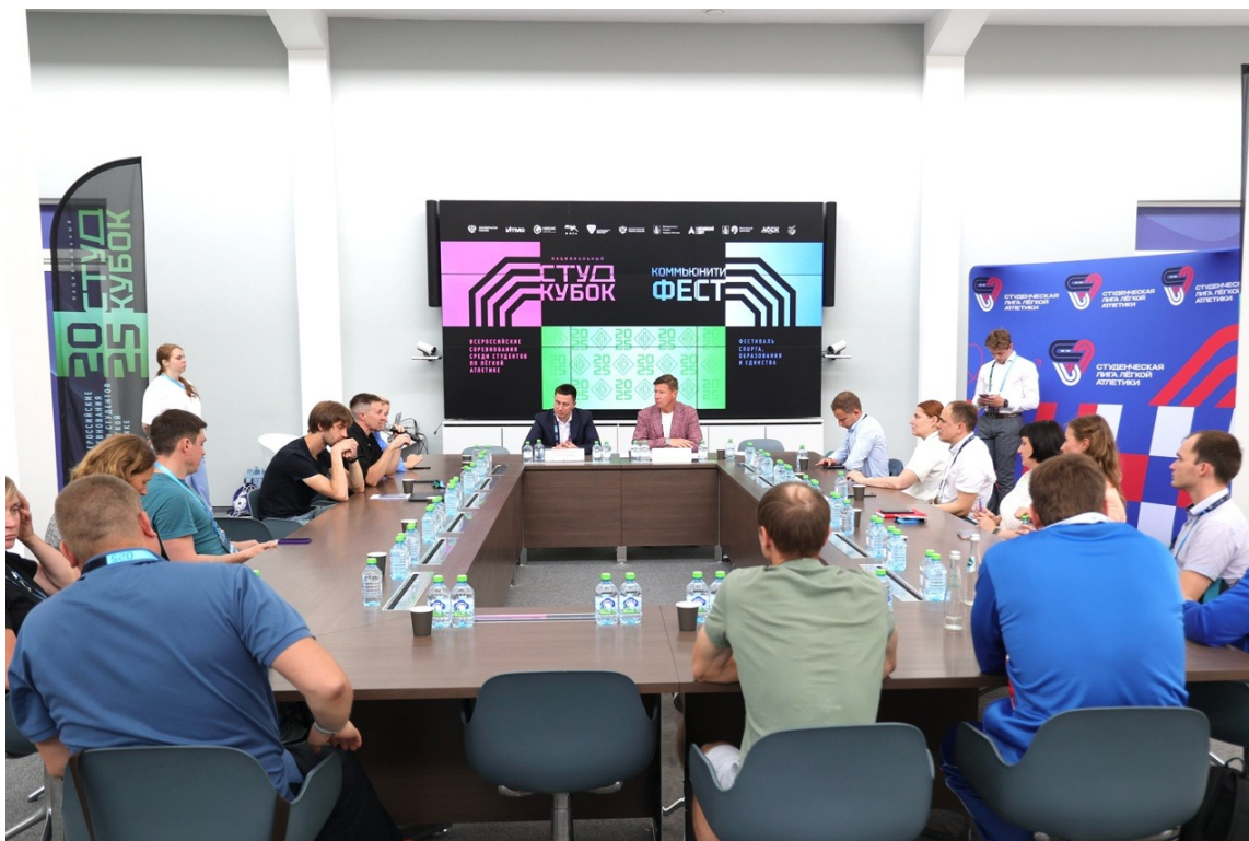
Круглый стол «Пространство возможностей для усиления статуса привлекательности студенческой легкой атлетики в России»

Meeting "A space of opportunities to enhance the status and attractiveness of student athletics in Russia"