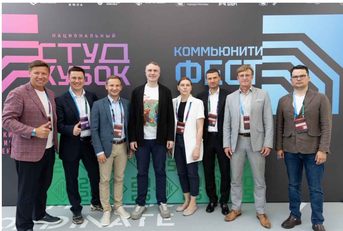
Почетные гости Комьюнити-феста Honorary guests of the Community Fest