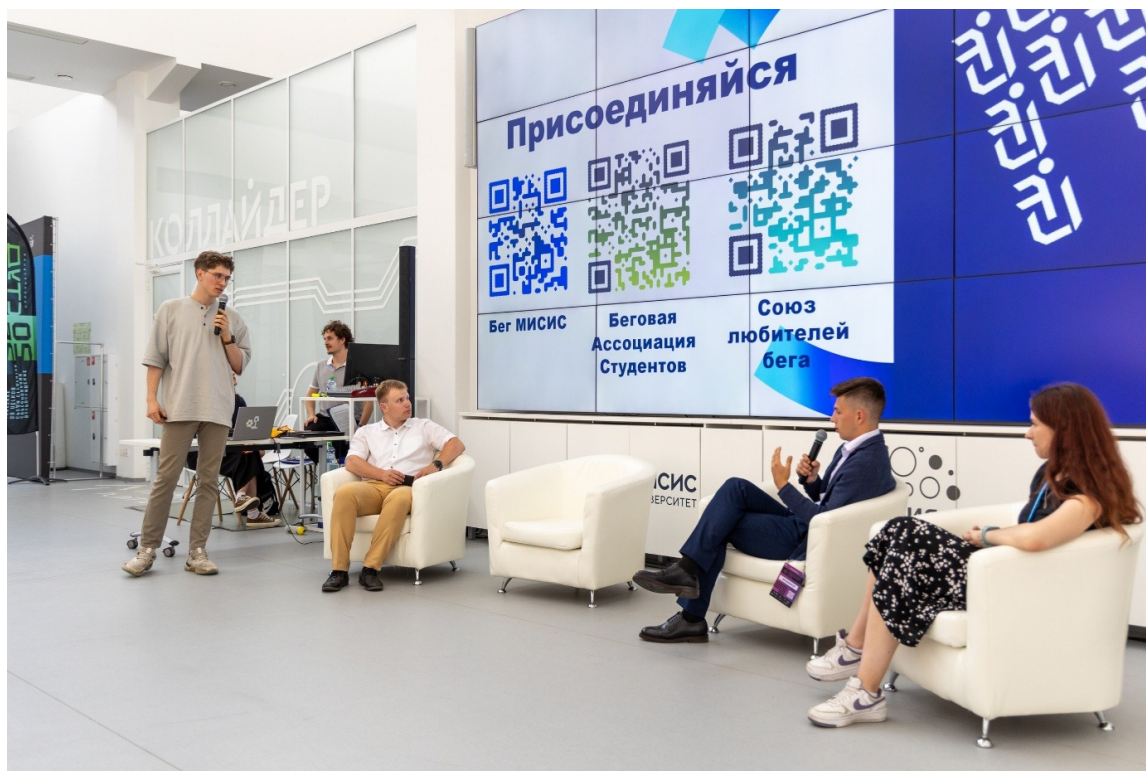
Дискуссионная сессия «Диалог на равных»

Discussion session “Dialogue on Equal Terms”