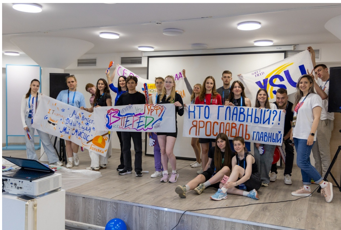
Мастер-класс по работе с сообществом болельщиков

Meeting "A space of opportunities to enhance the status and attractiveness of student athletics in Russia"