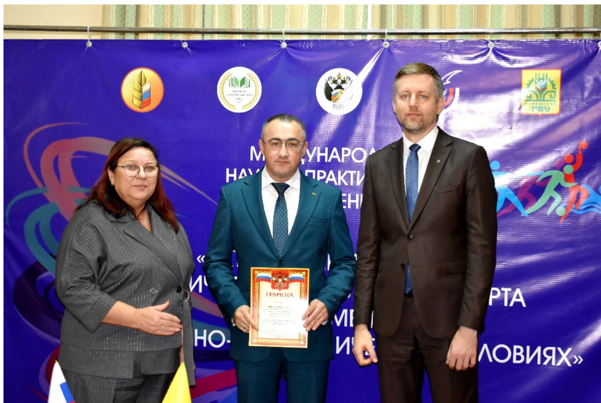
Награждение победителей и призеров Всероссийского смотра-конкурса на лучшую постановку работы по развитию физической культуры и спорта

Awarding of winners and prize-winners of the All-Russian review competition for the best staging of work on the development of physical culture and sports