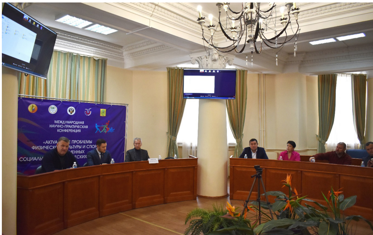
Заседание Совета по физической культуре и спортивно-массовой работе Meeting of the Physical Education and Mass Sports Work Council