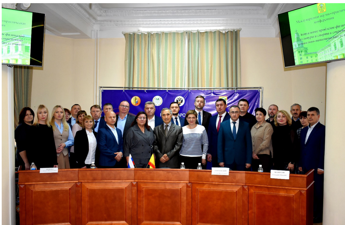
Участники научно-практической конференции в офлайн-формате Off-line participants of the scientific and practical conference