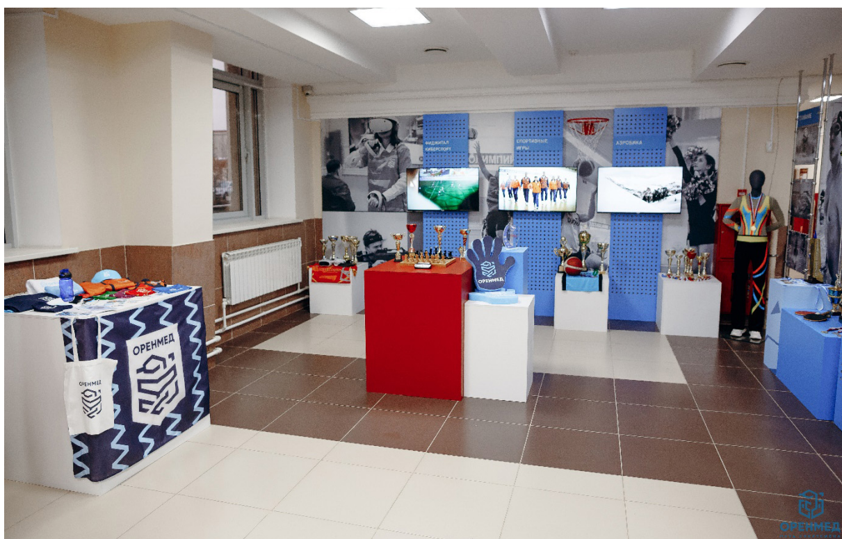
Музейная экспозиция Museum exhibition