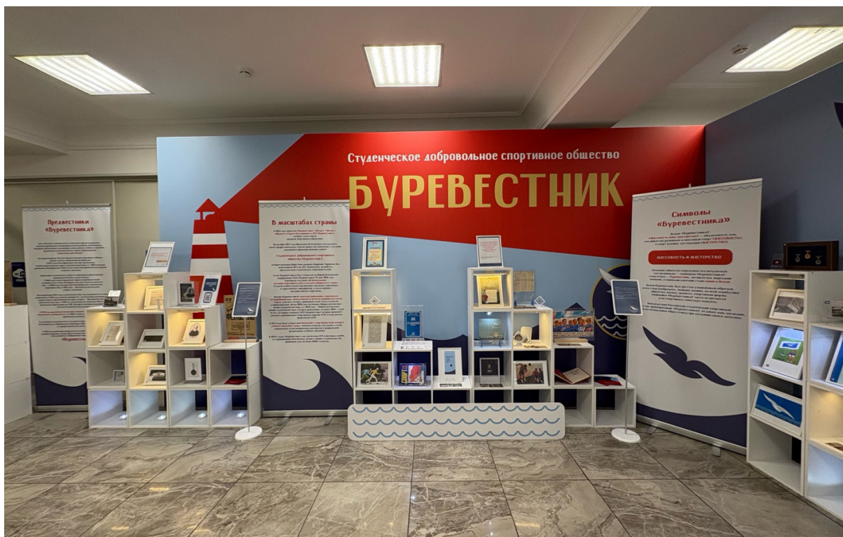
Экспозиция выставки, посвященной истории СДСО «Буревестник» в рамках Форума

Exposition of the exhibition dedicated to the history of the SVSS "Burevestnik" within the framework of the Forum