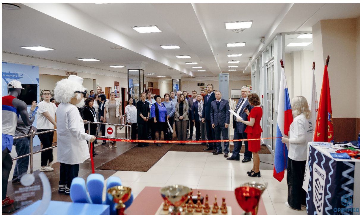
Торжественное открытие музея Grand opening of the museum