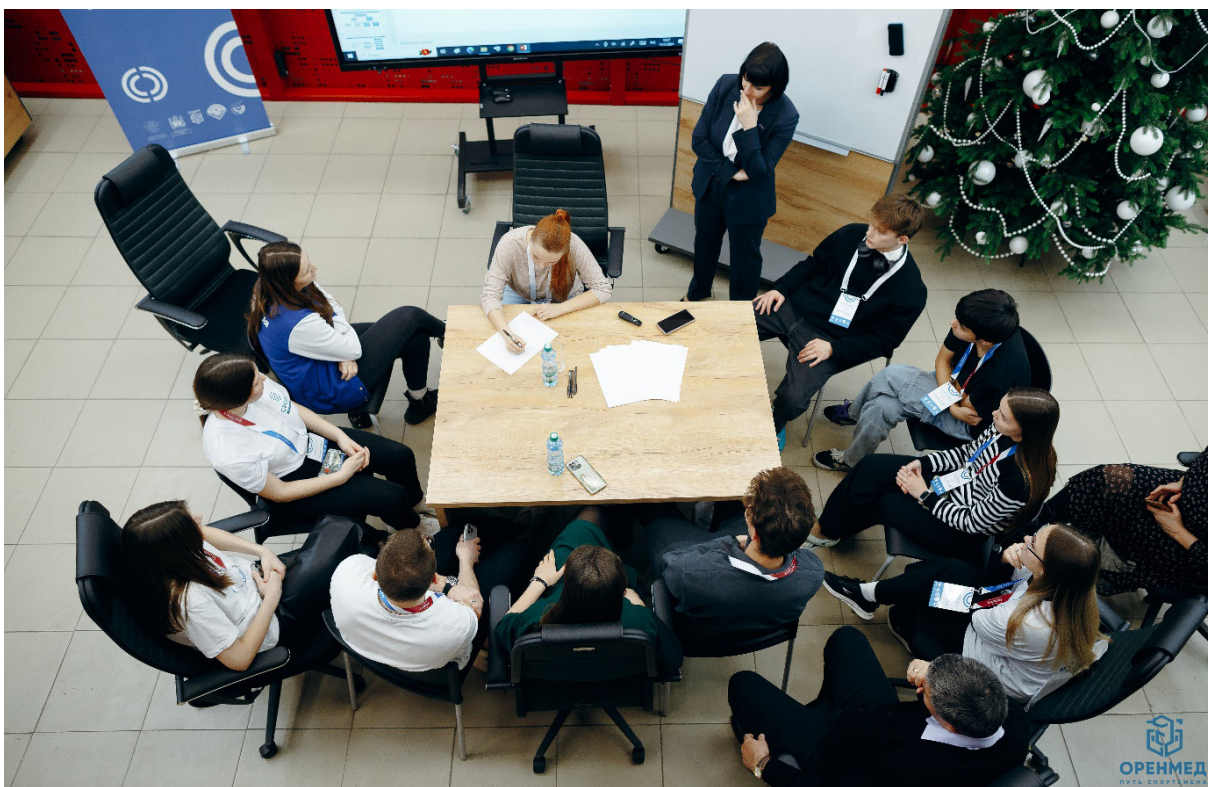
Участники стратегической сессии «Студенческий спорт Оренбуржья: взгляд в будущее из настоящего» Participants of the strategic session “Student sports in Orenburg : a look into the future from the present”