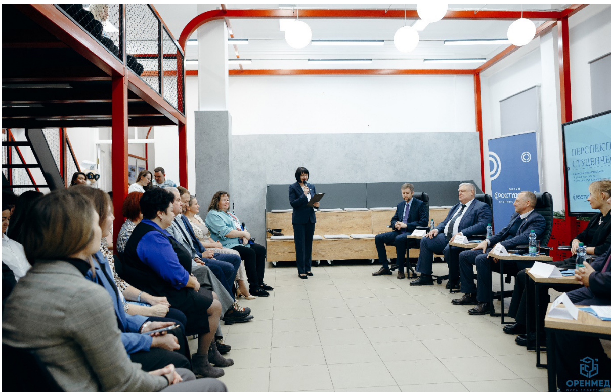
Участники пленарного заседания Participants of the plenary session