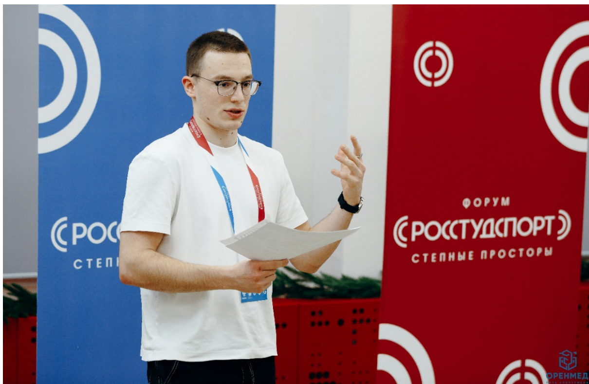
Выступление активиста группы по результатам стратегической сессии Speech by a group activist following the strategic session