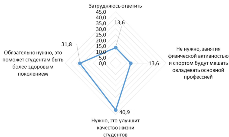
Рис. 2. Потребность в формировании и внедрении физкультурно-оздоровительной среды в образовательной организации, %