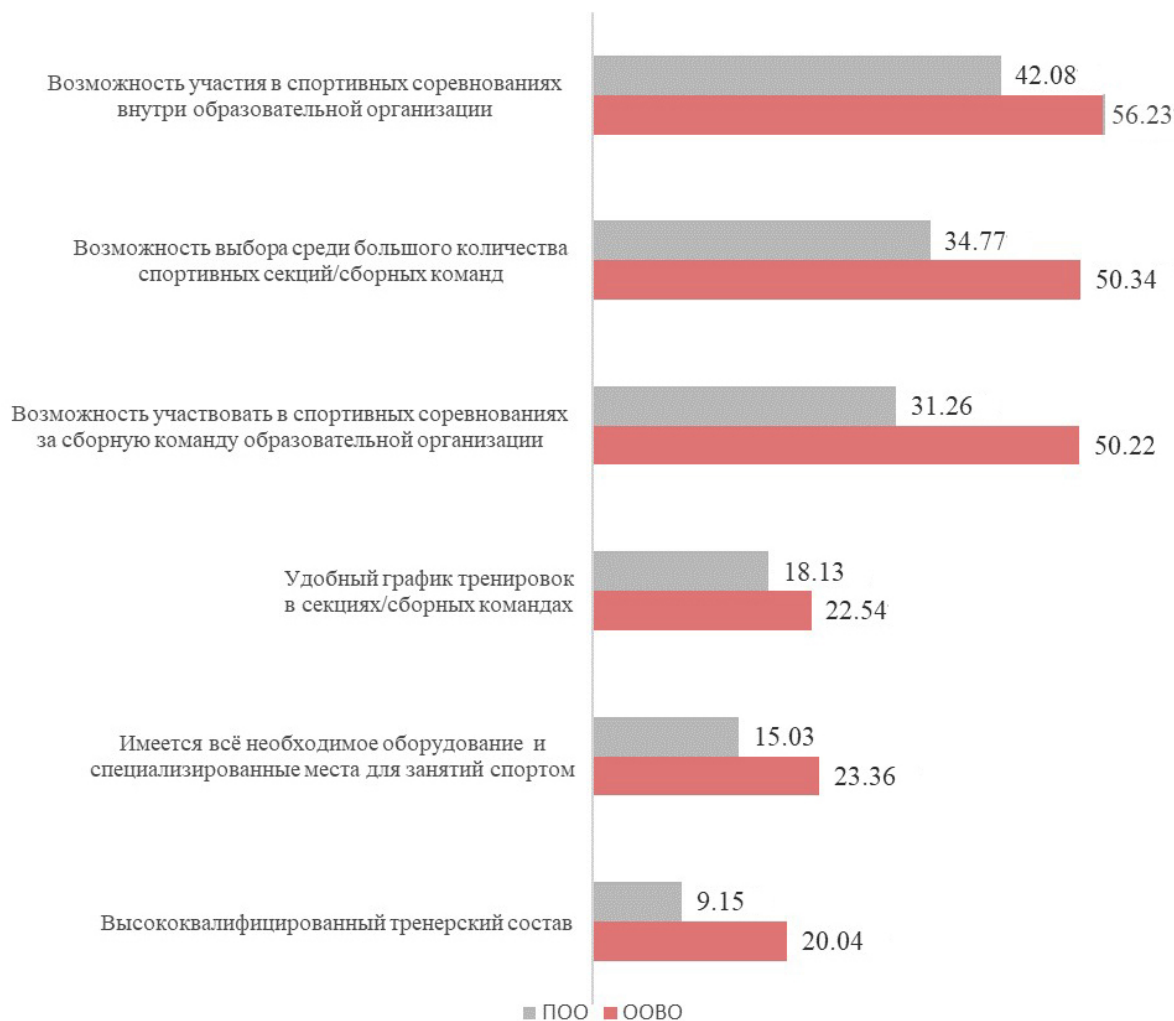
Рис. 3. Созданные условия для занятий спортом в образовательных организациях высшего образования и профессиональных образовательных организаций, по мнению студентов спортсменов-любителей, %