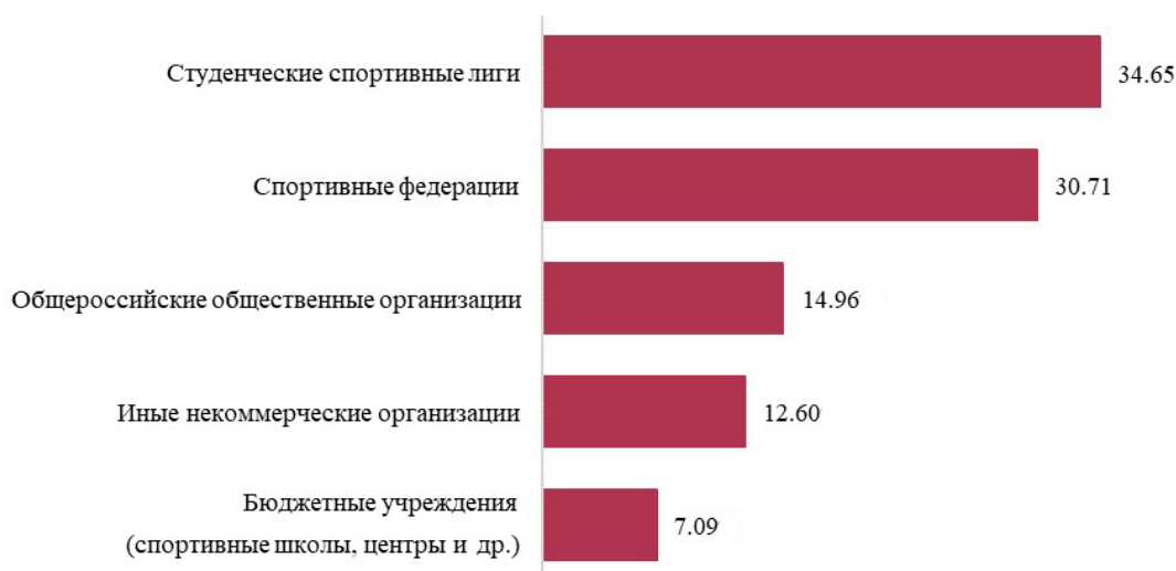
Рис. 3. Категории участников Конгресса «РОССТУДСПОРТ», представляющих некоммерческих организации, %