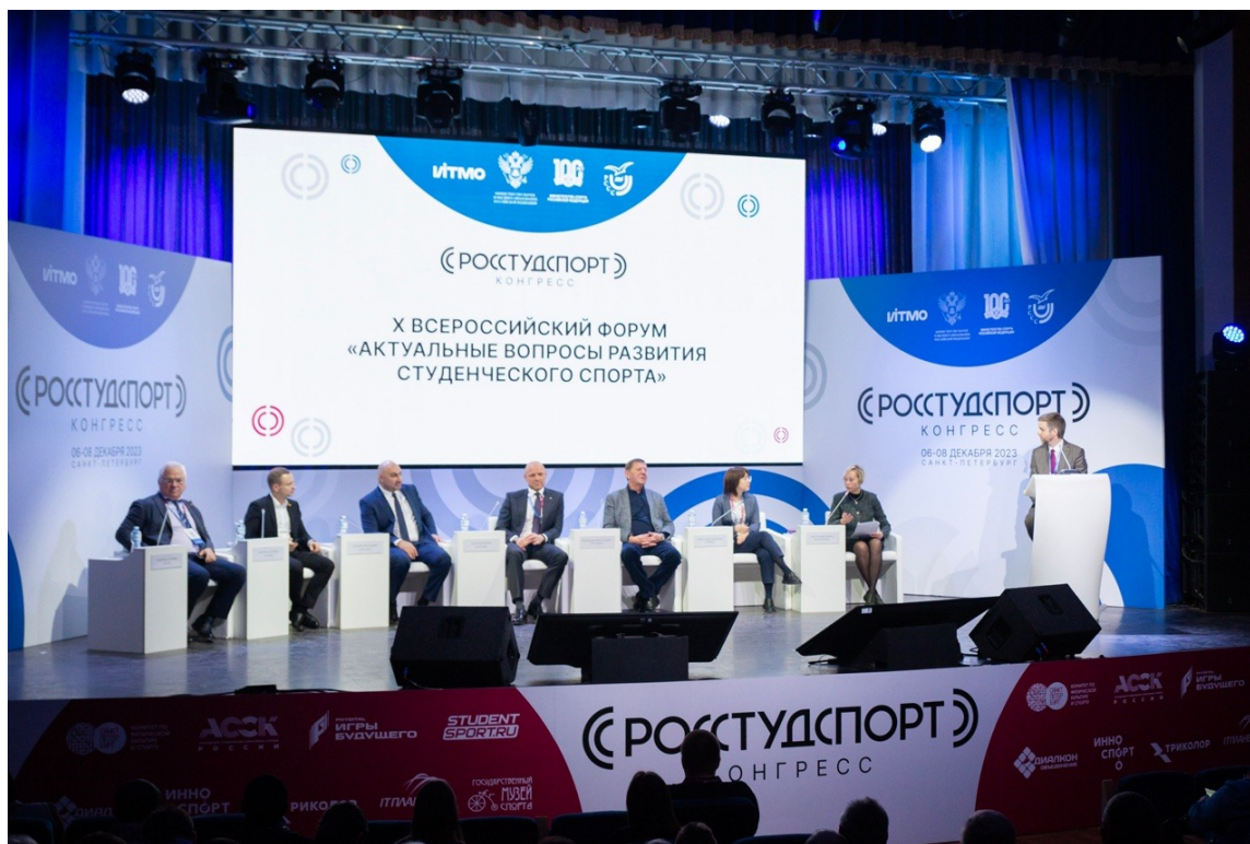
Пленарное заседание «Студенческий спорт 2030: взгляд в будущее из настоящего» Plenary session “Student sports 2030: A look into the future from the perspective of the present”

Центральная тема Юбилейного Форума – приоритеты развития студенческого спорта до 2030 г. – располагала к активному высказыванию мнения всех заинтересованных сторон. За годы проведения форума сформировалось вовлеченное сообщество экспертов, готовых обсуждать широкий круг вопросов развития студенческого спорта. Именно поэтому основной задачей Юбилейного форума стал поиск