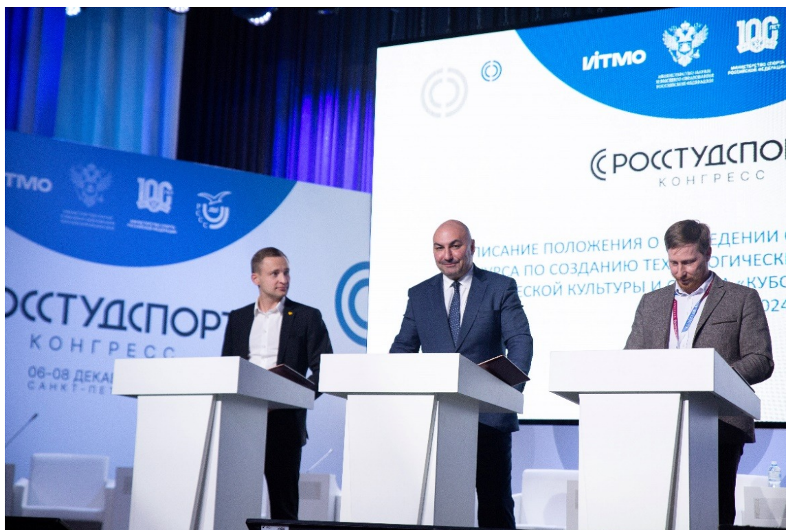
Подписание положения о проведении открытого молодежного конкурса по созданию технологических инноваций в области физической культуры и спорта «Кубок фиджитал спорттех инноваций 2024 года» Signing of a regulation on holding an open youth competition to create sport technological innovations “Sporttechcup 2024”