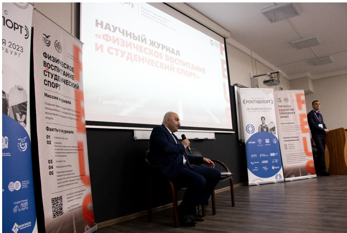
Презентация научного журнала «Физическое воспитание и студенческий спорт» Presentation of the journal “Physical Education and University Sport”