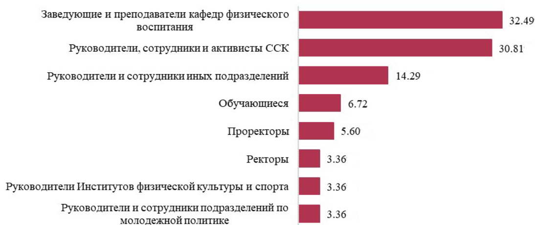
Рис. 2. Категории очных участников Конгресса «РОССТУДСПОРТ», представляющих образовательные организации высшего образования и профессиональных образовательных организации, %