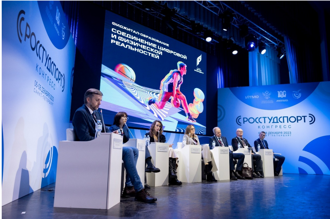
Панельная дискуссия «Кадры будущего для технологичных видов спорта»

Panel discussion “Education of the future for technological sports”