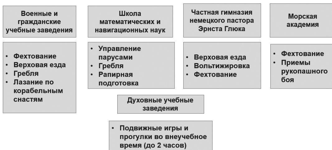
Рис. 1. Содержание физического воспитания и физической подготовки в учебных заведениях России в XVIII в.