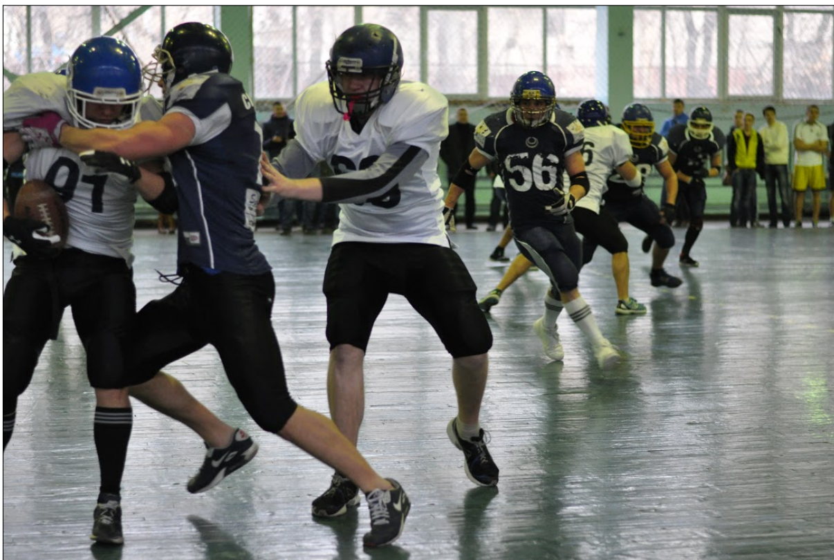
Команда «Скифы-ДонНТУ» на Празднике спорта ДонНТУ (2015 г.) Team "Scythians-DonNTU" at the Sports Festival of DonNTU (2015)

лающие в возрасте от 6 до 60 лет. Отмечено, что тестирование было проведено на высоком профессиональном уровне, и в дальнейшем возможно проведение уже республиканского мероприятия по сдаче норм ГФСК «ГТО ДНР».