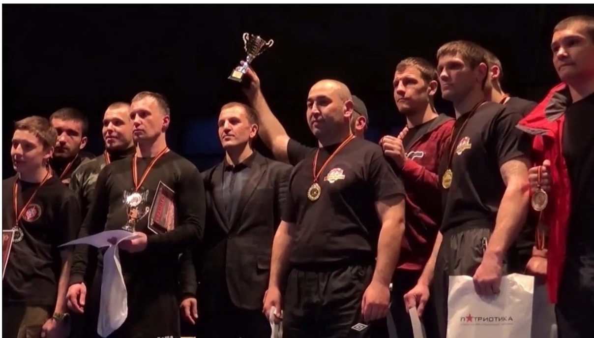
Команда спортивного клуба единоборств «Македон-ДонНТУ» – чемпион The team of the sports club of martial arts “Macedon-DonNTU” is the champion

фехтовальный клуб «Золотая сабля», баскетбольный клуб «ДПИ» [4].