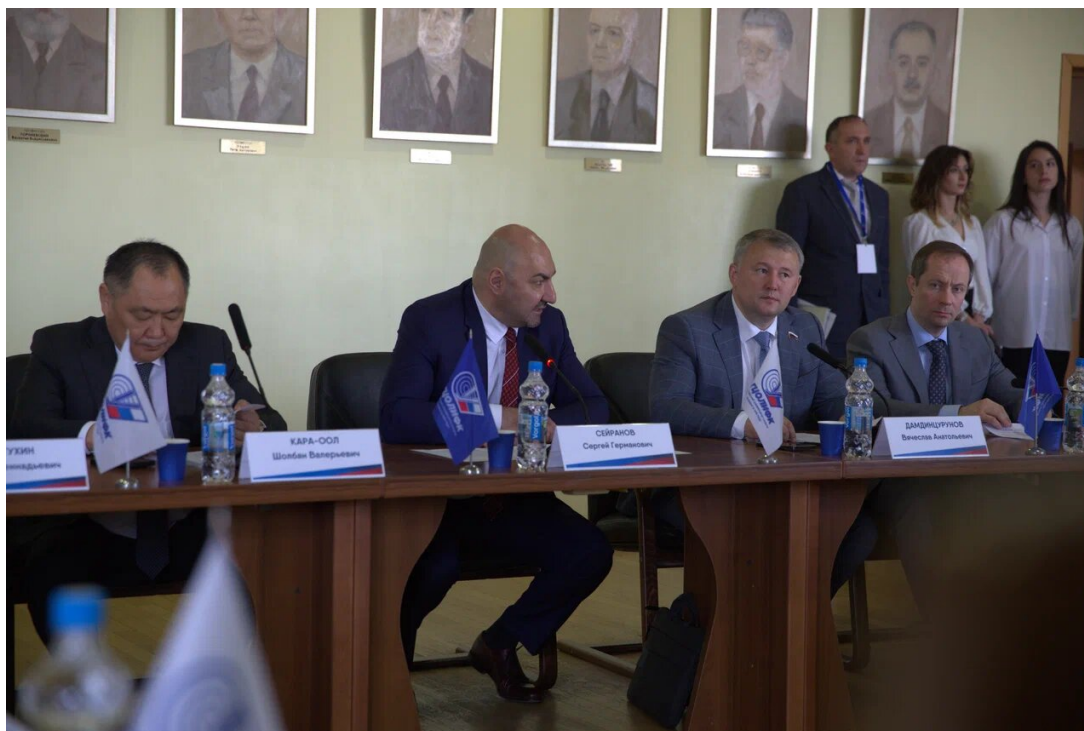
Заседание рабочей группы по совершенствованию системы патриотического воспитания граждан Российской Федерации при Комитете Государственной Думы по молодежной политике Meeting of the working group on improving the system of patriotic education of citizens of the Russian Federation under the State Duma Committee on youth policy