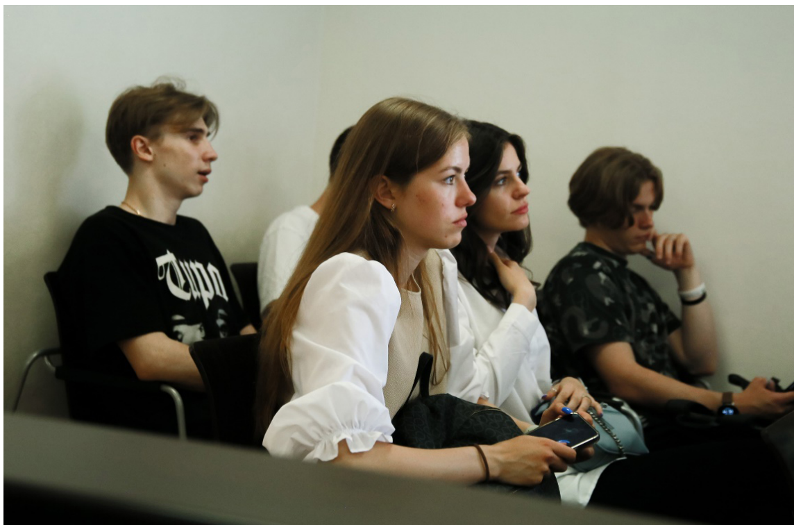
Дискуссионная площадка по патриотическому воспитанию средствами физической культуры и спорта

Ресурсами кадрового обеспечения молодежной политики на современном этапе является наличие структурных подразделений университетов, способных проводить актуальные исследования в сфере молодежной политики;