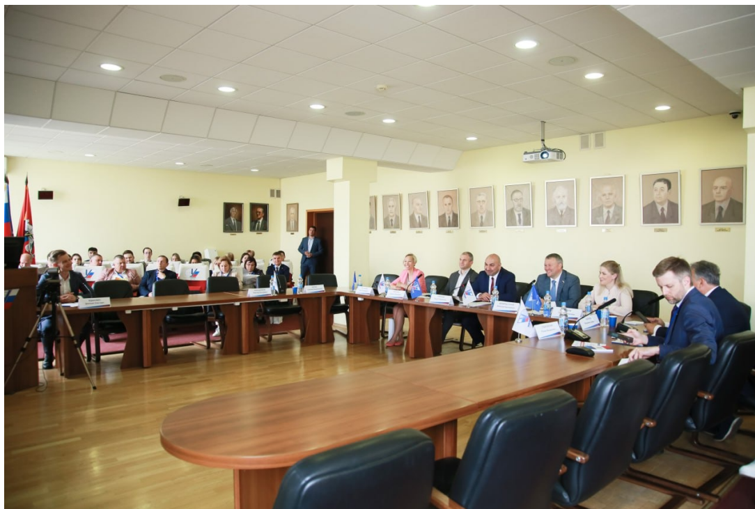
Пленарное заседание конференции Plenary session of the conference