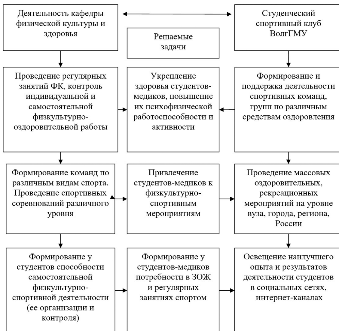
Рис. 1. Алгоритм взаимодействия кафедры физической культуры и здоровья и студенческого спортивного клуба ВолгГМУ с целью оптимизации оздоровительной работы

деления вуза работают согласованно и взаимосвязанно, используя свои функциональные возможности. Такое согласованное действие позволяет более эффективно решать вопросы физкультурно-оздоровительной работы. Так, при решении задач укрепления здоровья обучающейся молодежи на кафедре целенаправленно ведется организованная учебная работа. Ее дополняет деятельность спортивного клуба, направленная на формирование команд по нестандартным видам спорта и средствам оздоровления. Это позволяет вовлечь большее количество студентов в физкультурно-массовую работу.