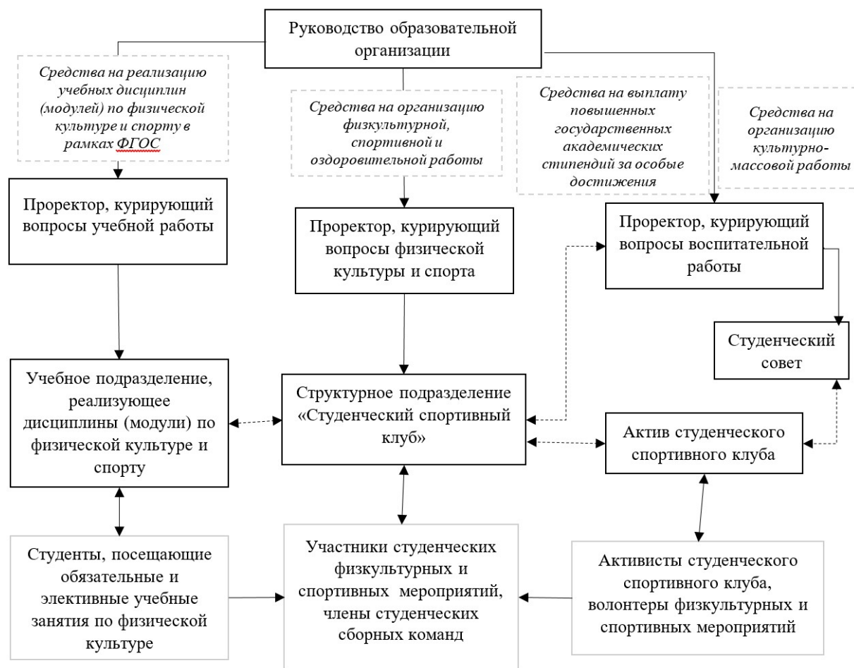
Рис. 4. Модель финансирования студенческих спортивных клубов