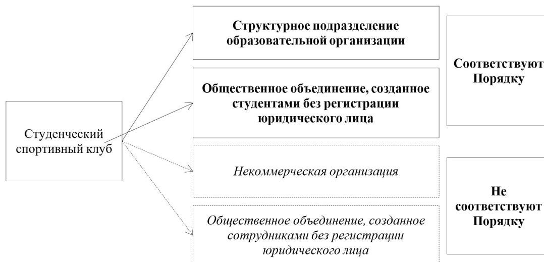
Рис. 1. Существующие организационно-правовые формы студенческого спортивного клуба