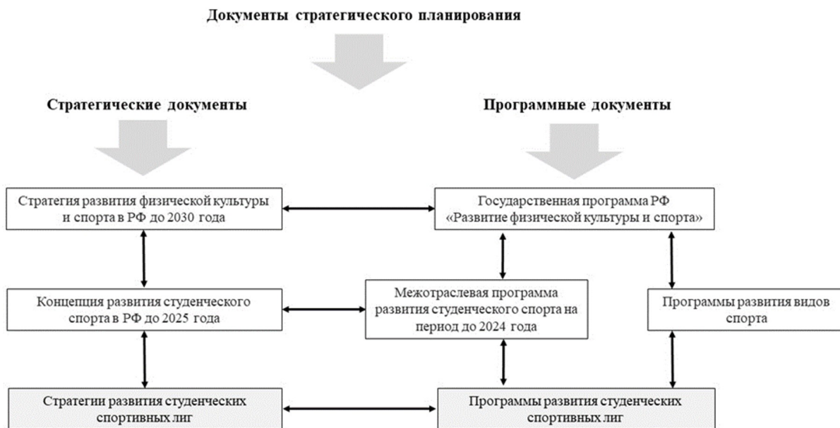
Рис. 2. Взаимосвязь стратегий и программ развития студенческих спортивных лиг с документами стратегического планирования в области физической культуры и спорта

Система стратегического планирования, согласно Федеральному закону «О стратегическом планировании в Российской Федерации», представляет собой механизм обеспечения согласованного взаимодействия участников стратегического планирования на основе принципов стратегического планирования при осуществлении разработки и реализации документов стратегического планирования [13]. Важно отметить, что положения данного Федерального закона распространяются напрямую